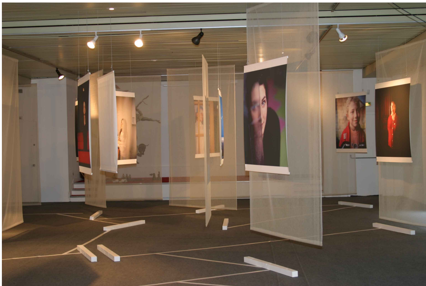
L'exposition telle que présentée dans le cadre du Festival des Transphotographiques 2007. Format : 110 X 110 cm. Pour tout renseignement, merci de nous contacter.